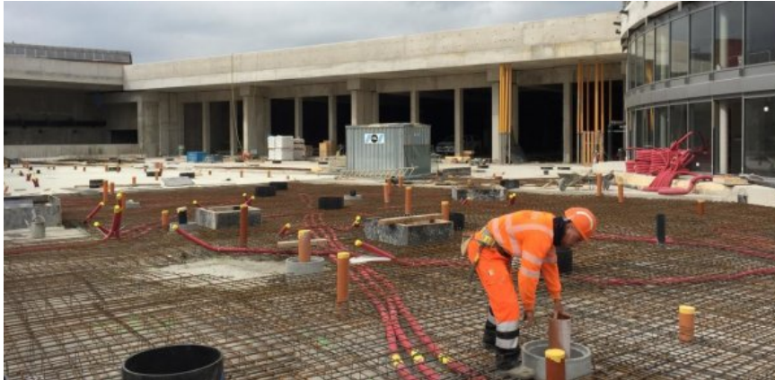
Le chantier du dépôt TPG En Chardon, en mai 2018, devant les portes de sortie des trams.

Une entreprise italienne qui oeuvre sur le site du dépôt En Chardon sous-paierait ses employés. Elle nie. Prévenus, les TPG assurent avoir respecté les règles.