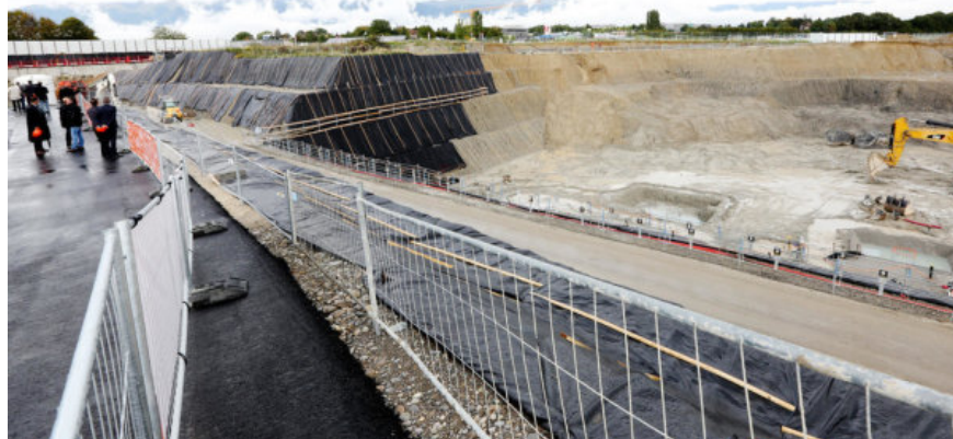
Les travaux du dépôt TPG pourraient accuser un retard de 18 mois.

La société soupçonnée de dumping salarial a quitté soudainement les travaux du dépôt TPG il y a dix jours. Le chantier est ralenti.