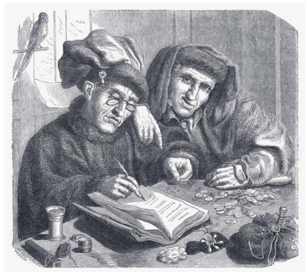
Les collecteurs d'impôts, par Quentin Massys, fin des années 1520

La FMB est cependant consciente que la simple suppression de la TPC pourrait mettre certaines communes dans une situation difficile. La FMB soutient donc l'idée d'un contreprojet qui mette à profit la prochaine révision de la fiscalité des entreprises. En effet, Genève et la Suisse devront dans les années qui viennent mettre en œuvre de nouvelles règles internationales d'imposition des entreprises, comprenant un taux d'imposition minimal de 15% pour certaines d'entre elles. Dans ce cadre, prévoir des compensations pour les communes affectées par la suppression de la TPC aurait du sens et permettrait de faire d'une pierre deux coups. Par contre, toute compensation de la suppression de la TPC par une simple hausse d'impôt est à rejeter.